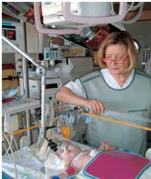
■ Abb. 3: Röntgen eines Neugeborenen auf der Intensivstation mit fahrbarem Gerät

kinder lassen sich z.B. durch eine Spieluhr oder ein Stofftier von ihrer Angst ablenken.