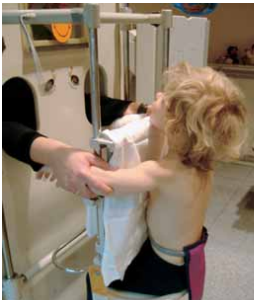
■ Abb. 2: Am Kinderstativ sitzender kleiner Junge