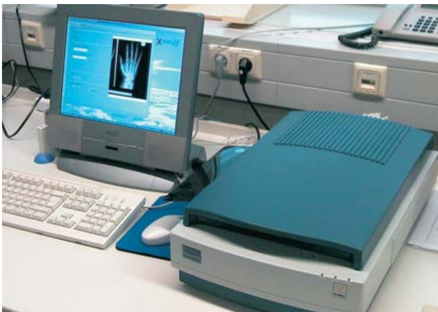
■ Abb. 1: Pronosco-X-Posure System TM – bestehend aus hochauflösendem Röntgenbildscanner, Computer mit spezieller Analyse-Software

die verminderte Aufnahme wichtiger Substanzen über den Magen-Darm-Trakt, der Bewegungsmangel und die häufig verminderte